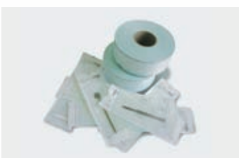
Пакеты и рулоны КЛИНИПАК Tyvek