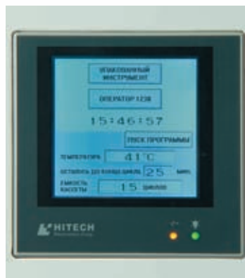
Сенсорный русифицированный экран