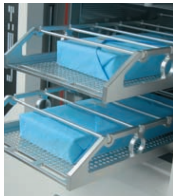
Максимальное использование объема камеры