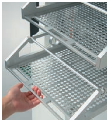
Удобные выдвижные полки

Прямоугольная форма камеры обеспечивает больший объем единовременной загрузки по сравнению со стерилизаторами, имеющими цилиндрическую форму камеры.