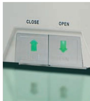
Ножное открывание двери