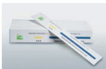
Химические индикаторы 1-го класса