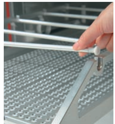
Легкая регулировка высоты полок