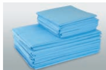
Нетканый материал SMS

ПАКЕТЫ И РУЛОНЫ КЛИНИПАК Tyvek (производства МК ВИТА-ПУЛ) представляют собой комбинированную упаковку разнообразных размеров, состоящую из прозрачной двухслойной пленки и нетканого материала, соединенных между собой термошвом. Срок годности упаковки Tyvek составляет 5 лет. Срок хранения изделий в упаковке после стерилизации — 2 года. На упаковку нанесены химические индикаторы, меняющие свой цвет после стерилизации.