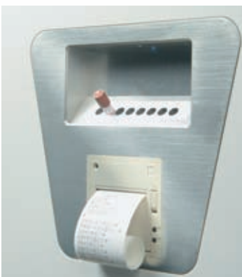
Встроенный инкубатор и принтер

Полностью автоматизированный процесс стерилизации проходит под постоянным контролем микропроцессора. ЖК русифицированный сенсорный экран представляет собой диалоговую платформу между компьютером и оператором. Встроенный биологический инкубатор для проверки эффективности стерилизации полностью автоматизирован и легок в использовании. Принтер выводит на печать как текущие параметры, так и результаты и параметры предыдущих циклов стерилизации.